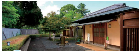
四日市市茶室「酒翠庵」 @yhsuan ローカライズ