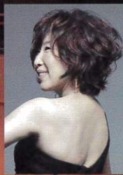
ケイコリー (ラオーカル)