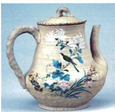
白土手捻水差 ▶