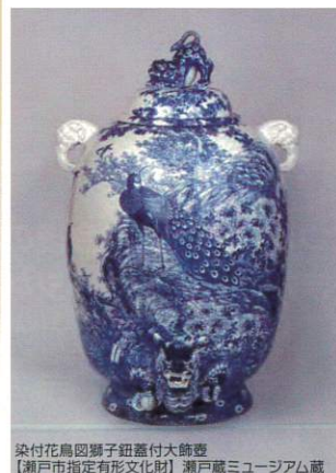
染付花鳥図獅子紐蓋付大鉢壹 【瀬戸市指定有形文化財】 瀬戸蔵ミュージアム蔵

愛知県瀬戸市は、千年余りのやきものの歴史と伝統を有し、陶器と磁器を生産する産業地として、日本のやきもの界をリードしてきました。今回の企画展では、瀬戸蔵ミュージアムと瀬戸市美術館が所蔵する1万点以上の作品群から選りすぐった作品を、章ごとのテーマに沿って展示します。平安より現代まで、受け継がれる瀬戸焼の技と美をご堪能下さい。