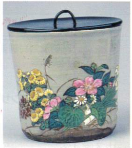
森有節 作 色絵草花文水指 (四日市市立博物館 所蔵)

萬古焼の源流である古萬古の名品ばかりを集めた林コレクションは、昭和39年、四日市市の企業家、林純之介氏が永年収集された萬古焼を四日市市に寄贈されたものです。沼波弄山の代名詞でもある赤絵作品から写し物、森有節の盛絵、腥臑脂釉(しょうえんじゆう)など美しい技法が施された作品、それに加え、萬古焼の派生である射和萬古、安東焼も含め、萬古焼の流れがわかる作品構成です。平成18年には三重県指定有形文化財に指定され、美術的、歴史的に重要な資料となっています。