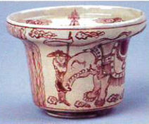
沼波弄山作 赤絵象唐子文小鉢 (四日市市立博物館 所蔵)