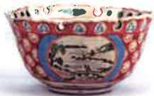
色絵窓山水文雪輪鉢

萬古焼は、今から 280 年ほど前の江戸時代中頃に、桑名の沼波五左衛門弄山 (ぬなみごさえもんろうざん 1718 ~ 1777) が作り始めた焼き物です。昨年弄山が生誕して 300 年という記念の年でした。いつまでも変わらず繁栄せよとの願いと、自身の作品が永遠に誇りうるものとの自負を込めて「萬古不易」の印を押したことが、名前の起源とされます。楽焼、唐津焼、織部、伊賀焼などの写し物 (模倣) もたくさん作りましたが、赤絵作品に見られる山水画と更紗模様との組み合わせは異国情緒を漂わせる斬新なデザインで、人々の興味を引きつけました。今回は古萬古と呼ばれる、沼波弄山と森有節の美と技の作品をご覧ください。