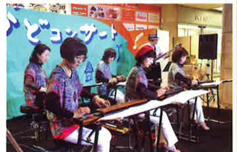
昨年開催の様子より

申込先 〒510-0075 四日市市安島二丁目5-3 四日市市文化会館内 まちかどコンサート実行委員会