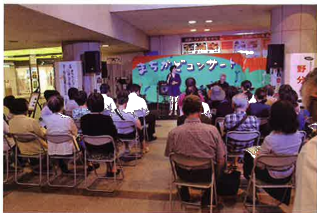
昨年9月開催の様子より

申込先 〒510-0075 三重県四日市市安島二丁目5-3 四日市市文化会館内 まちかどコンサート実行委員会