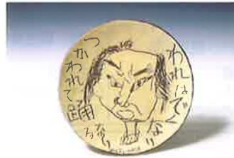
われはでくなり 1985年(92歳)