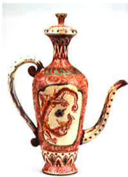
色絵窓籠鳳凰文盛蓋瓶 (四日市市立博物館蔵)

4月15日(土)～7月2日(日) 9:30～16:30 入場無料 休館日 月曜日(第2月曜日を除く)