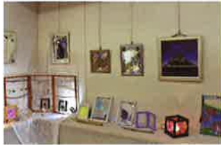
今年 1 月開催「素敵なガラスアート・クラフト作品展」より