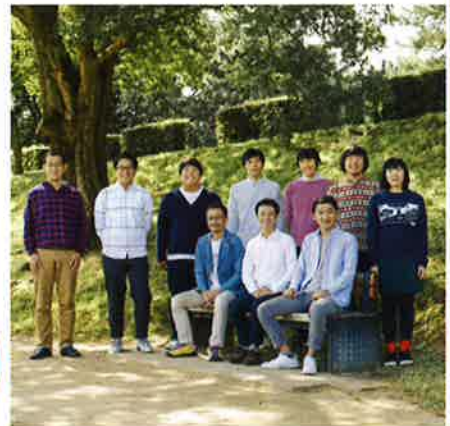
企画・制作協力: 名古屋演劇教室

自分の中から強烈な獣の匂いがしたので、大阪のおっさんの劇をやりたいと思いました。僕は京都で劇を作ってますが、大阪は近いようで遠くて、深いところを触らせてもらえないようなところがあって。とりわけ「新世界」という街にはひどく憧れがありました。レトロフューチャーそのままの名前と街の感じに。ジャンジャン横丁には将棋サロンがありましてね、近くにはゲームセンターがあって、そこにも将棋ゲームがやっぱりあっておっさん天国だったりして。そんな新世界を舞台上に SF を夢想しました。おっさんがドローンと戦ったり、ロボットアームに王手飛車取りを迫られたり、ホログラフィの娘と言い合いしたり、そういう来たるべき、来くさるべき、来てけつかるべき新世界を描けたらと思います。(脚本・演出 上田誠)