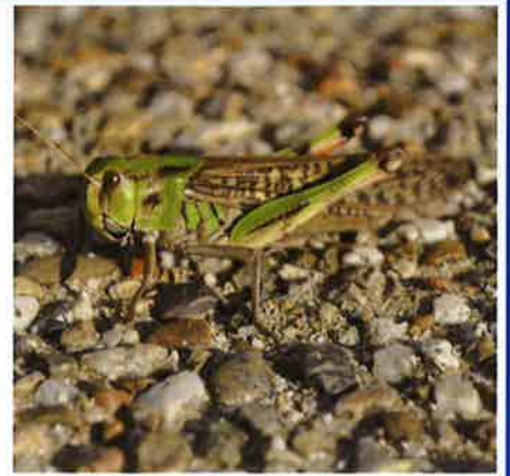
トノサマバッタ (メス)

夏が近づくと虫たちの活動は活発となり、周囲で見かける機会が増えますね。でもそんな虫たちを、私たちは良い悪いで勝手に区別します。気持ち悪いから?きれいだから?かゆいから?食べるから?…人間にとって良い虫、悪い虫とは何でしょうか?そんな虫たちをちよつとのぞいてみましょう。