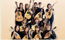
三重県ギターマンドリン連盟 / ギターマンドリン演奏