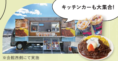
※会館西側にて実施