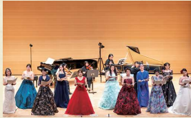
コッレーギ・ムズィカーリ / 声楽