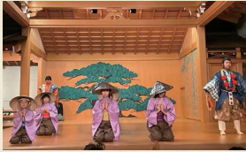
名張子ども狂言の会 / 狂言