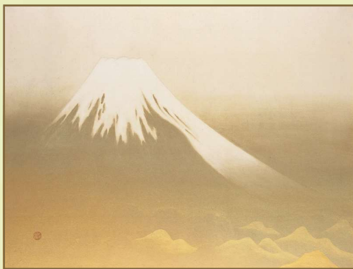
横山大観 / 「日本心」大正後期～昭和初期