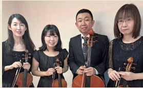
三重フィルハーモニー交響楽団 (弦楽四重奏) / クラシック